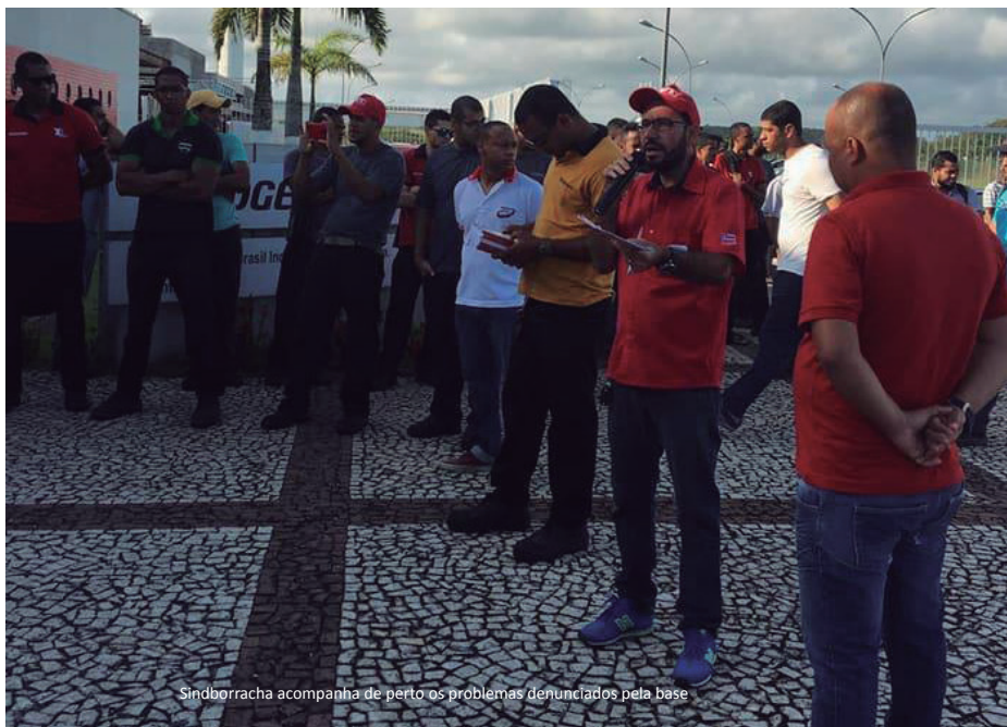
Sindborracha acompanha de perto os problemas denunciados pela base

A direção do Sindborracha vem atuando e cobrando melhorias em todos os veículos industriais – empilhadeiras e rebocadores elétricos, no que diz respeito à manutenção dos mesmos. Estes veículos fazem o transporte de material tanto na Área 1 quanto na Área 2 da Bridgestone. É necessário que todos os equipamentos estejam em condições adequadas de uso, oferecendo segurança aos trabalhadores.